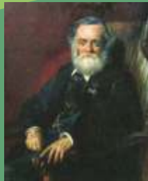
C. W. von Gümbel